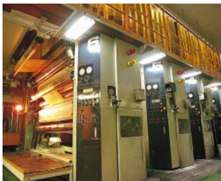
トモプレスト工場

は5億69百万円（同63.5%減）、中間利益は1億88百万円（同70.7%減）となりました。