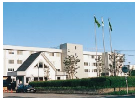
研究所（埼玉県岩槻市）

海外におきましては、米国サウスランドボックス社のコルゲーターの入替えを行い、生産能力の増強を図り、当上半期の同社の生産・販売は共に前年同期比25%の増加となりました。また中国においては、台湾最大の板紙・段ボールメーカーである正隆股份有限公司と三菱商事株式会社との合弁で、上海に段ボール事業会社（上海中豪紙品加工有限公司）を設立し、10月から本格稼働いたしました。