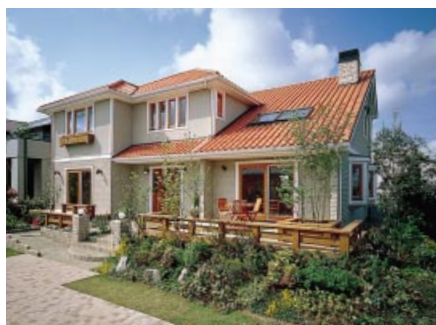
スウェーデンハウス

以上の結果、当上半期の売上高は328億21百万円（前年同期比2.2%減）、経常利益